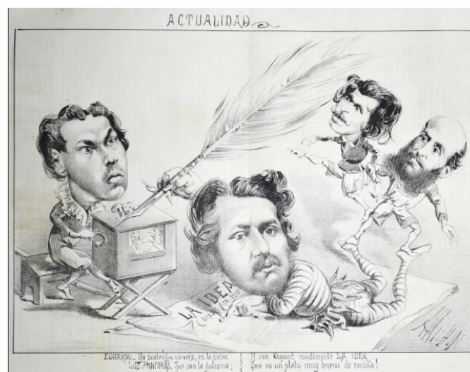
Imagen 3 – Actualidad