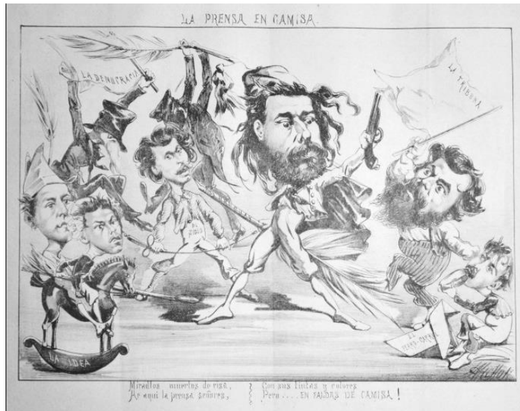
Imagen 4 – La prensa en camisa