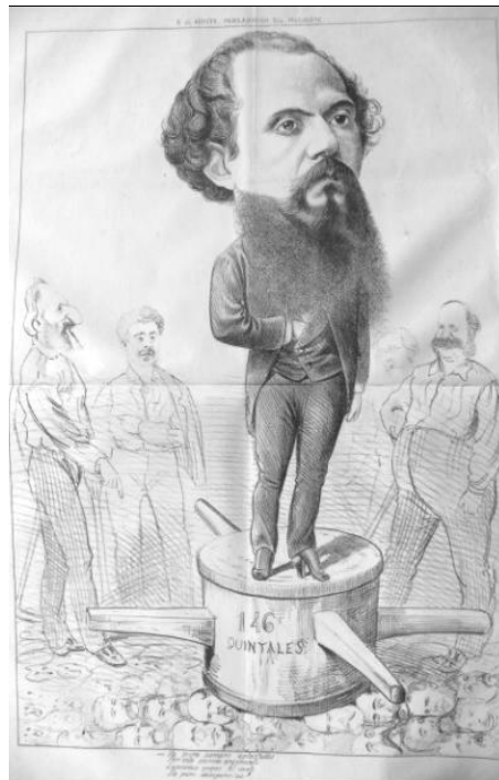
Imagen 1 – 6 de agosto. Proclamación del presidente.