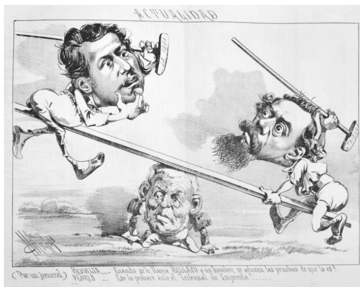
Imagen 6 - Actualidad